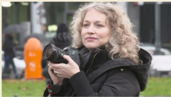
Die Fotografin Benita Suchodrev

Benita Suchodrev wurde in der ehemaligen Sowjetunion geboren und emigrierte mit 15 Jahren in die USA. In New York studierte sie Kunst mit dem Schwerpunkt Kunstgeschichte. Anschließend absolvierte sie einen Masterstudiengang in englischer Literatur. 2008 zog sie nach Berlin und begann dort, die multikulturelle Kunstszene zu dokumentieren. Ihre Arbeiten waren in zahlreichen Einzel- und Gruppenausstellungen zu sehen. Außerdem ist sie in der Rafael Tous Foundation for Contemporary Art in